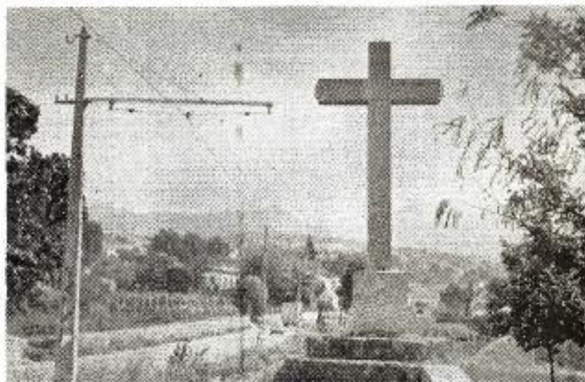
Bella panorámica de Huétor Vega desde la Cruz de Piedra. Como telón de fondo la albura de Sierra Nevada. Tierra privilegiada. Nieve y trópico. Huertas, jardines naranjos, viñedos. «Agua oculta que llora»...

Reinante en esta época Felipe II y heredero de tan vasto imperio, no sólo trató de conservarlo, sino de ampliar sus fronteras. Tuvo muchísimos problemas. Su intervención con-