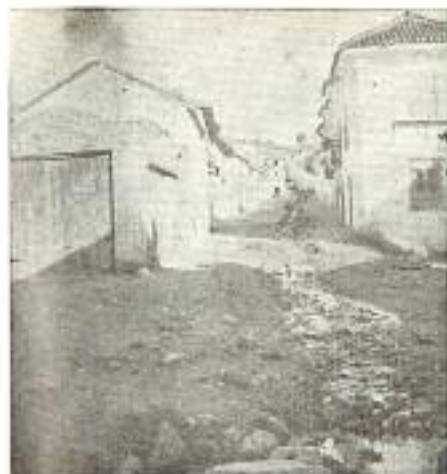
Vista de la calle Real tomada el 25-XII-1893 a las 2 de la tarde. Podemos ver el Barranco al descubierto. Al fondo el Pasadizo de entrada al horno. En último término la encina de la Era Empedrada. Todo modificado.

tra los Turcos, Francia, Inglaterra, etc. requerían abundancia de naves y no tuvo escrúpulo en ocasionar una exagerada despoblación terrestre en casi toda España. Las circunstancias se agravaron de tal modo que no se dudó en establecer medidas preventivas.