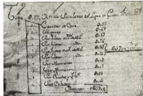
Foto de la estadística original

timonios escritos. La primera sociedad municipal organizada, con un organismo rector competente (ayuntamiento) aparece así: